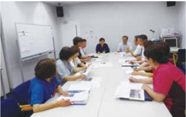
「多職種連携のカンファレンス」

平成26年度の診療報酬改正で新設された地域包括ケア病棟を同年度5月に取得しました。高度な急性期医療に対応している当院では、入院当初から在宅復帰を見据えた関わりを多職種協働で介入しています。特に当該病棟では、患者様が望まれる地域で安心して暮らしていただける様に、個別のきめ細かい退院指導や、必要時には行政や地域の多職種の方々との連携を図りながら計画的に在宅療養支援を行っています。