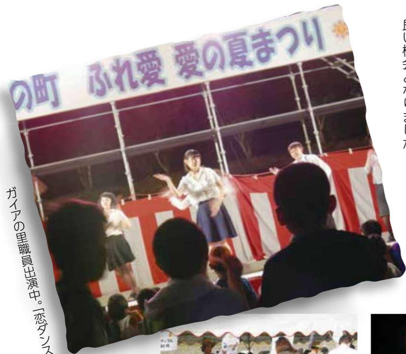
ガイアの里職員出演中。「恋ダンス」

去る8月20日(日)に雲仙市愛野町のふれ愛夏の夏まつりにガイアの里職員が今年も参加させていただきました。 恒例の冷凍パイン出店では多くの方にご利用いただきました。そしてステージ出演では「恋ダンス」を披露しました。 たくさんの方の地域の皆様との交流ができる良い機会となりました。