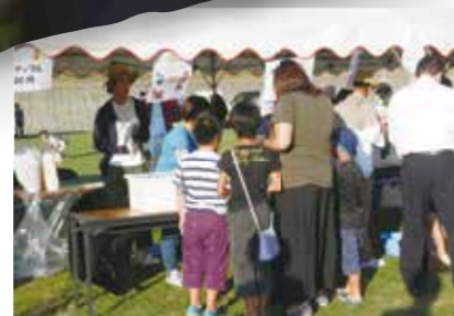
冷凍パイン出店。今年も売り切れました～

去る8月20日(日)に雲仙市愛野町のふれ愛夏の夏まつりにガイアの里職員が今年も参加させていただきました。 恒例の冷凍パイン出店では多くの方にご利用いただきました。そしてステージ出演では「恋ダンス」を披露しました。 たくさんの方の地域の皆様との交流ができる良い機会となりました。