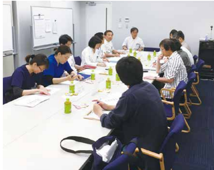
公立新小浜病院感染チームと合同カンファレンス

内容はインフルエンザやノロウイルス、薬剤耐性菌、結核等の感染症の発生および抗菌薬やアルコール・石けん使用状況等についてです。それぞれの立場から情報・意見交換し、地域を含めた感染対策について検討しています。