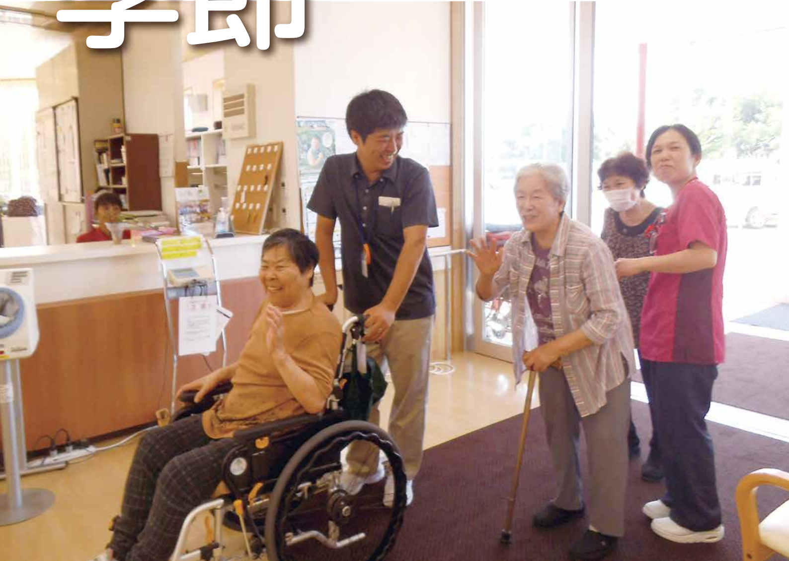
通所リハビリテーション送迎の様子

〒854-0301 長崎県雲仙市愛野町甲3838-1 TEL (0957) 36-0015 FAX (0957) 36-1027 ホームページ http://www.ainomhp.jp/