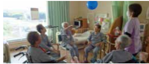
風船パレーで見事なアタック!

厚生労働省によると日本の認知症患者数は平成24年462万人であったのが、平成37年には700万人になるとの推計値が報告されています。国は社会全体で支援する戦略としてさらに強化した認知症施策推進総合戦略(新オレンジプラン)を打出しています。病院に於いては診療報酬に認知症ケア加算が新設され算定要件には患者個人に沿った手厚いケアが義務化されました。当院では認知症加算2を取得しています。認知症対応委員会を設けて所定の対応向上研修を受けた看護師が中心となり全職員が適切な対応が出来るようにと取り組んでいます。今回は脳の活性化を図り認知症の進行を遅らせ、身体機能の維持向上を目的にこの7月から実施している病棟デイケアについて紹介します。病棟デイケアのポイントは、一見通所リハと同じようなレクメニューですが、患者様個人を理解している見慣れた看護職員が、患者様の特徴や生活背景等を把握した上で、個人の好み等に沿ったレクができるように工夫している事です。風船パレーでは思わずボールに手を出すその瞬間ベッド上では見られない様な活き活きとした笑顔や体の動きをされます。適度に体を動かすことで食欲増進や夜間の良眠にもつながっています。認知症ケアの基本姿勢には有名なユマニチュード理論があります。それは『患者様を見る時患者様と話をする時、患者様に触れる時、患者様が立つ時』という4つの柱に沿って『人間らしさ』『その人らしさ』を尊重して一人一人に丁寧に関わる方法で、患者様に望ましい変化を期待できるものであり、患者様のことを一番把握している病棟スタッフだからこそ出来るとして各病棟が知恵を出し合って取り組んでいます。