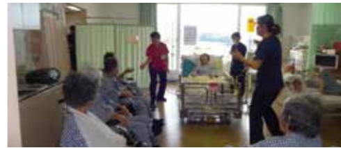
風船パレーはベッド上でも出来ます。