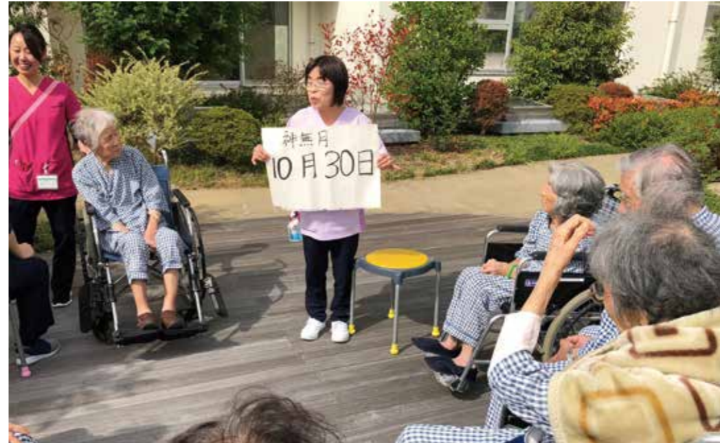
秋晴れのもと庭園で、まず月日の確認。"さあ~、のど自慢の始まり!"