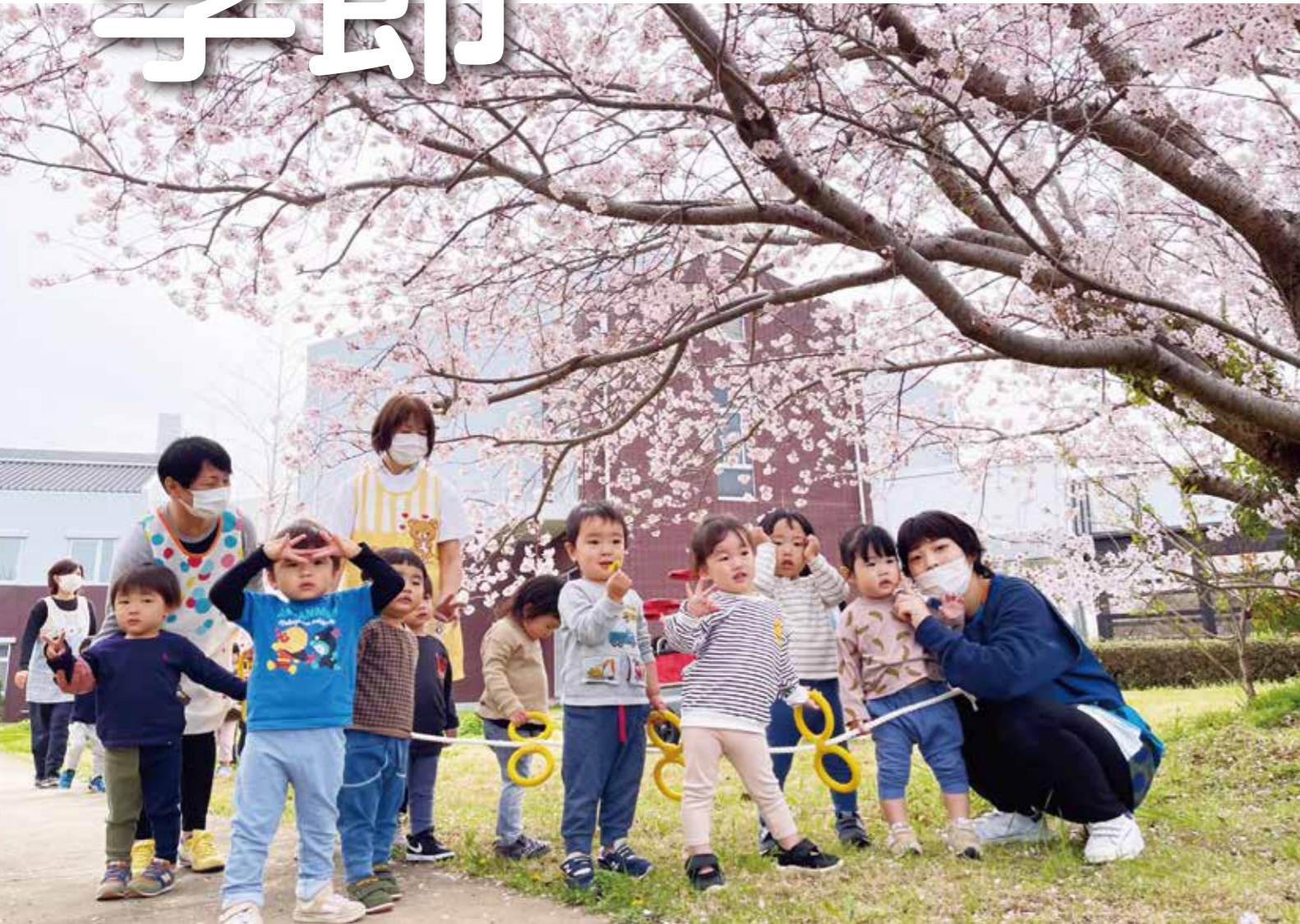
こどもの丘ナーサリーの子どもたち

〒854-0301 長崎県雲仙市愛野町甲3838-1 TEL (0957) 36-0015 FAX (0957) 36-1027 ホームページ http://www.ainomhp.jp/